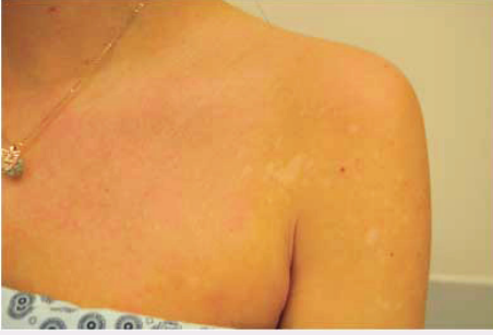
Gövde ve sol omuzda tinea versikolor