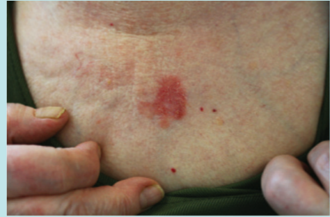
Gövde de aktinik keratoz

Aktinik keratoz, uzun süreli kontrolsüz güneşe maruz kalmaya bağlı olarak en çok güneş gören bölgelerde görülen deride anormal hücre gelişimini yansıtan deri değişiklikleridir. En sık yüzeyi pürüklü yama şeklinde görülürler. Aktinik keratozların düşük oranda deri kanserine dönüşme riski vardır.