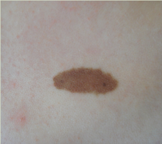
Küçük doğumsal ben

Küçük boyutlu ve düzgün yüzeyle, vücudun kolayca izlenebilecek bir alanına yerleşmiş olanlar düzenli aralıklarla (6 ay-1 yıl gibi) dermatologlar tarafından takip edilebilir. Takip, derinin üst tabakalarını incelemeyi sağlayan dermoskop adı verilen bir cihazla yapılır. Böylece bende potansiyel olarak oluşabilecek kanser gelişimi açısından meydana gelebilecek değişiklikler erken dönemde saptanabilir. Saçlı deri gibi takibi zor olan bölgelerdeki benler ise, gerekirse hemen cerrahi olarak çıkartılabilir. Büyük boyutlu, yüzeyle düzgün olmayan, hızla değişiklik gösteren benler sıklıkla en erken dönemde çıkartılmalıdır.