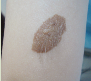
Orta büyüklükte doğumsal ben