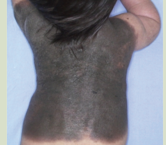
Dev doğumsal ben