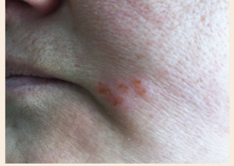
İyileşmesi tamamlanmak üzere olan uçuk