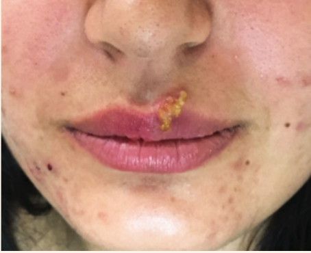
Kabuklarıyla iyileşmekte olan uçuk

En sık dudaklar, ağız etrafı, burun ve çenede ortaya çıkar ve 5-7 gün içinde su dolu kabarcıkların kuruması ve kabuklanma ile iyileşir.