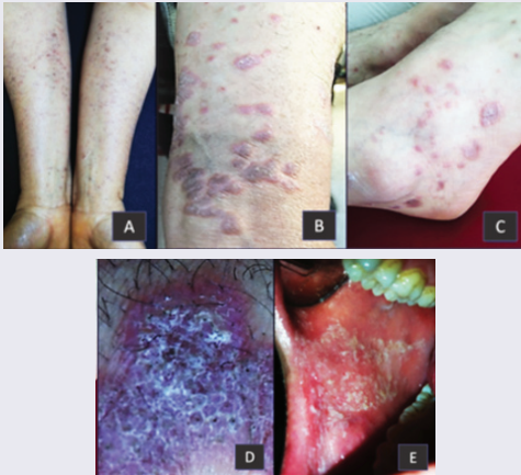
Resim 1 A-E. Liken planusun deri ve ağız içi belirtileri.

Hastalık; başlıca ağız içi ve genital olmak üzere mukozaları ve daha nadiren saçlı deri ile tırnakları da tutabilir (Resim 1.E). Derinin sürtüldüğü, örselendiği veya kaşındığı alanlarda çizgisel yeni lezyonların çıkması tipiktir. Bu nedenle liken planuslu hastaların derilerinin travmadan korunması gereklidir.