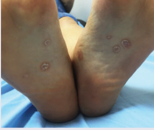
Ayak tabanında kepekli kızarıklıklar

Yaklaşık 2 yıl içinde 2. dönem belirtileri denilen ve her türlü deri hastalığını taklit edebilen bulgular ortaya çıkar. Bunlar vücutta ortaya çıkan döküntüler, el ayası ve ayak tabanındaki yaralar, ağız içinde beyaz kabarık lezyonlar, anal bölgede deriden kabarık yumuşak lezyonlar, saçlarda güve yeniği gibi dökülmelerdir. Hastalık bu dönemde de bulaşıcıdır.