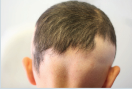
Ense de yaygın alopesi