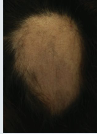
Baş arka kısmında geniş yerleşimli alopesi