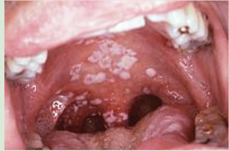
Ağız içinde Kandida enfeksiyonu