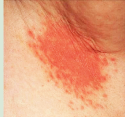
Koltuk altında parlak kırmızı rengi ile Kandidal enfeksiyonu

Kandidiyazis maya tipi fırsatçı mantarlardan Candida albicans 'ın neden olduğu deri ve mukozalarda ortaya çıkan bir enfeksiyondur.