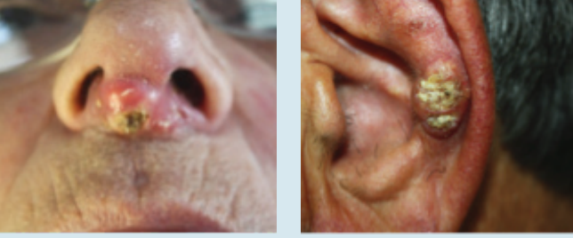
Skumöz Hücreli Karsinom

Skumöz Hücreli Kanser: Güneşe maruz kalan bölgelerde sıklıkla baş ve boyunda görülür ve özellikle kulak, dudak ve eller ile kolların arka yüzünde gelişme eğilimindedir. Bazal hücreli karsinoma benzeyebilir ancak daha kabarık ve kabukludur. Skumöz hücreli kanserler tedavi edilmezse alt dokulara geçebilir ve derin yaralara dönüşerek dokulara hasar verebilir. Olguların az bir kısmında da lenf nodlarına ve diğer uzak organlara yayılabilir ve ölümlerle sonuçlanabilir.